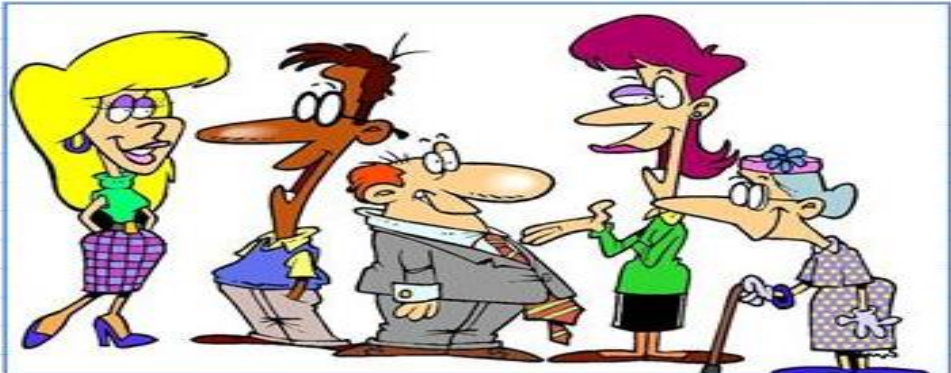
Eva Tom Joe Tina Miss Tate

Complete with like , likes , don't like or doesn't like according to the chart.